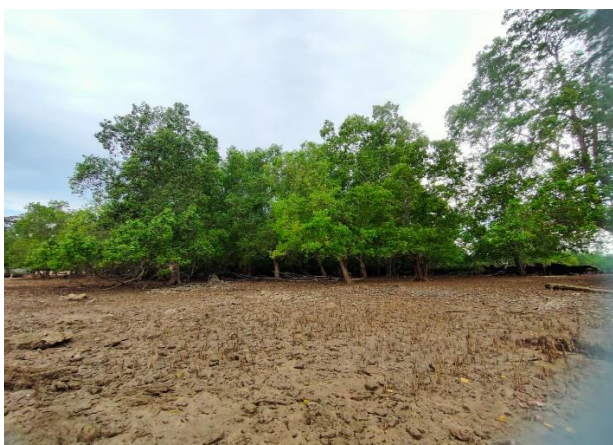
Gambar 2. Habitat M. meretrix di Pulau Nangka, Bangka Tengah