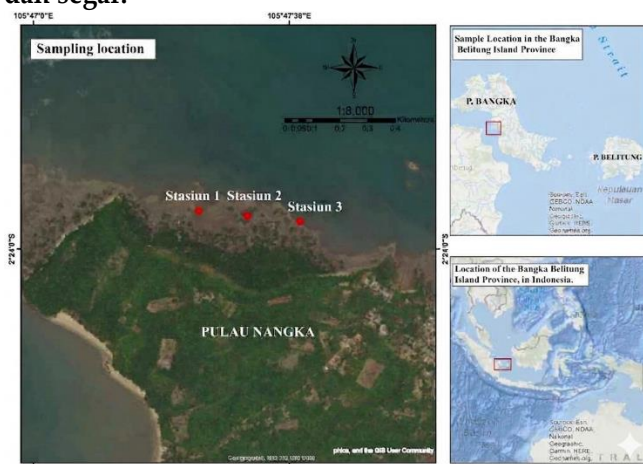
Gambar 1. Pengumpulan sampel M. meretrix di Pulau Nangka

dilakukan pada musim kelimpahan tertinggi yaitu bulan Juni, sehingga kelimpahan tinggi dan memudahkan mengumpulkan dalam jumlah banyak. Sampel M. Meretrix dimasukan dalam wadah terbuka yang berisi air laut agar tetap hidup dan segar.