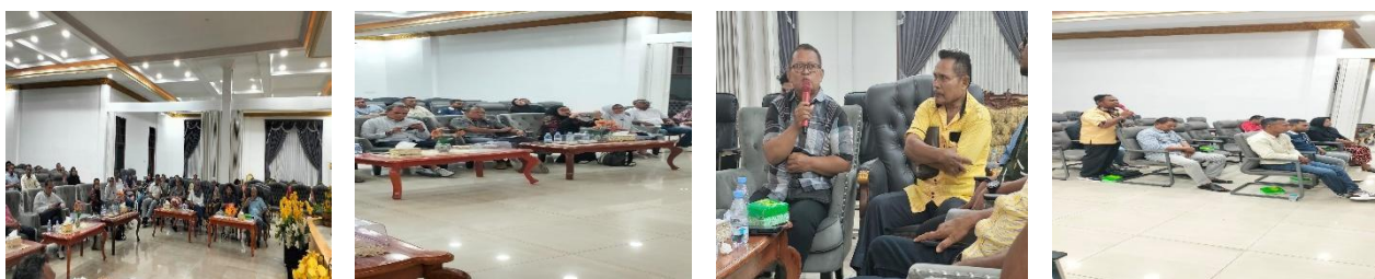
Gambar 2. Suasana penyampaian materi pelatihan kapasitas wirausaha (Peluang dan Ide Bisnis)

muhibah, komunikasi dan diskusi, mengikuti atau mengunjungi pameran, Pendidikan, dan searching internet. Dalam menciptakan peluang bisnis perlu mempertimbangkan beberapa hal yakni kebutuhan, kemampuan, kegemaran, dan lokasi (Nasrullah, 2019). Sumber-sumber peluang yang berasal dari kesempatan umumnya berasal dari dalam diri sendiri dan lingkungan internal dan eksternal. Suasana penyampaian materi dan diskusi dalam pelatihan dapat dilihat pada Gambar 2.