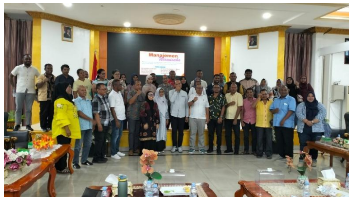
Gambar 3. Foto Bersama Pj Sekda, Kadis Koperasi dan UMKM, Kadis PMD, Kepala Desa/Kelurahan di Kecamatan Pulau Dullah Selatan, Peserta Pelatihan, dan Tim Polikant

tepat yang perlu dilakukan adalah studi kelayakan. Studi kelayakan yang mendalam dilakukan terhadap ide bisnis yang muncul untuk melihat layak tidaknya ide bisnis tersebut meliputi aspek finansial, yakni: Rugi Laba (R/C) & Cash Flow (NPV, IRR, Net B/C, PP) dan aspek non finansial, yakni: Pasar, Manajemen, Produksi, Hukum, Lingkungan, Sosek. Studi kelayakan bisnis kajian untuk menentukan apakah sebuah ide bisnis layak untuk dilaksanakan atau tidak (Suliyanto, 2010). Manfaat utama kajian kelayakan terhadap ide bisnis adalah mengurangi risiko kerugian, meningkatkan peluang sukses, dan memudahkan dalam pengambilan keputusan serta perencanaan bisnis yang lebih matang. Kajian ini juga penting untuk menarik minat investor dan kreditor dengan menunjukkan kredibilitas dan kelayakan ide bisnis secara objektif. Kegiatan pelatihan ini berlangsung selama \pm 3 jam dan diakhiri dengan foto bersama PJ Sekda Kota Tual, Kepala Dinas Koperasi, Kepala Dinas PMD, Kepala Desa/Kelurahan di Kecamatan Pulau Dullah Selatan, peserta pelatihan, dan tim Polikant. Gambar 3.