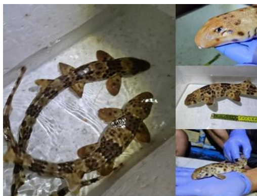
Gambar 2. Calon Induk Hiu Berjalan Halmahera

Morotai. Gambar calon induk hiu berjalan sesuai dokumentasi berikut.