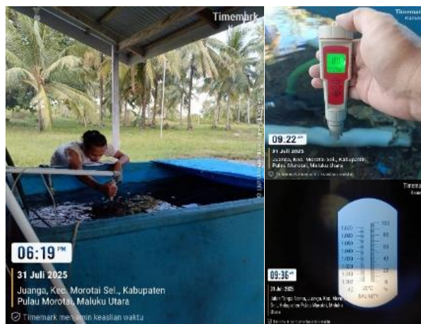
Gambar 3, Pengukuran Parameter Lingkungan

dan pakan lainnya berupa udang dan cumi yang mengandung protein. Menurut hasil penelitian yang telah dilakukan sebelumnya (Jutan et al., 2019) jenis makanan yang paling disukai adalah berupa ikan kecil dan jenis crustacea.